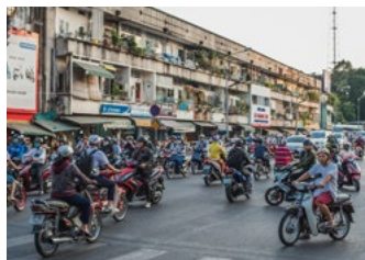
Trafic urbain dangereux