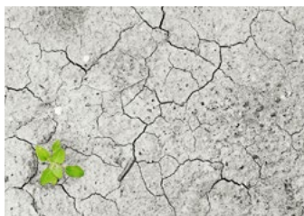
Assèchement des sols