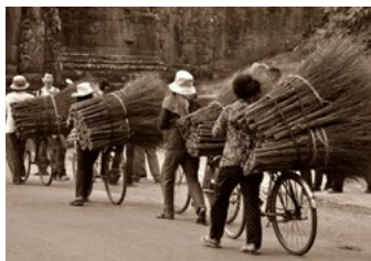
Travail Physique - Rémunération faible