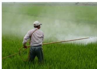
Utilisation des produits chimiques