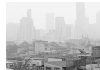
Pollution de l'air